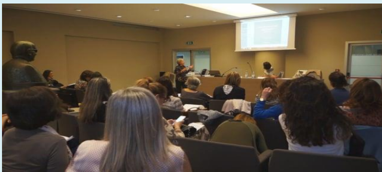
L'AUDITORIUM "A. ZOLI" DEL CONSIGLIO DELL'ORDINE

L' Auditorium Adone Zoli , la Saletta Associazioni e la Aula Didattica Blu sono riservate all'utilizzo da parte della Fondazione per la Formazione Forense, del Comitato Pari Opportunità dell'Ordine e delle Associazioni forensi del circondario per l'organizzazione di eventi a carattere formativo da offrire ad Avvocati e Praticanti.